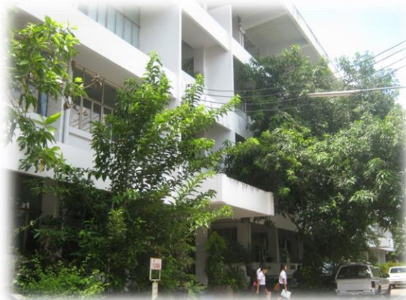
อาคาร 4 อาคารอัมพวัน