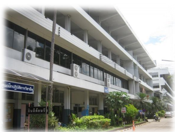
อาคาร 3 อาคารลีลาวดี

ชั้นที่ 4 ใช้เป็นห้องเรียนทฤษฎีสังคมศึกษา วิทยาศาสตร์ ภาษาไทย คณิตศาสตร์ และ ห้องพักรู