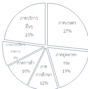
แผนภูมิโครงสร้างเศรษฐกิจจังหวัดอุตรดิตถ์